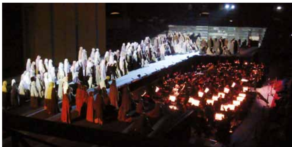
Grande emozione per i valdenghesi presenti all'arena di Verona: spettacolare il “Va' Pensiero”, III° atto del Nabucco di Verdi.

È un vero piacere partecipare agli eventi organizzati dalla Pro Loco di Valdengo. Dopo l'entusiasmo della rappresentazione “Nabucco” all'Arena di Verona, che ha emozionato i partecipanti per l'intensità dello spettacolo e la bellezza della location, per il “Progetto Arcobaleno” e con la collaborazione della Pro Loco, è stata organizzata la gita “150 anni a Torino e alla Reggia di Venaria” .