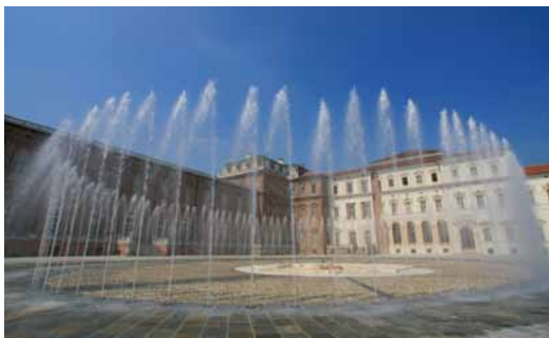
La splendida reggia di Venaria Reale

Quota: euro 60 per i residenti; euro 75 per i non residenti.