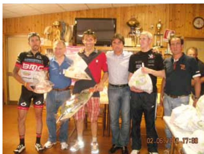
Un momento festoso della premiazione