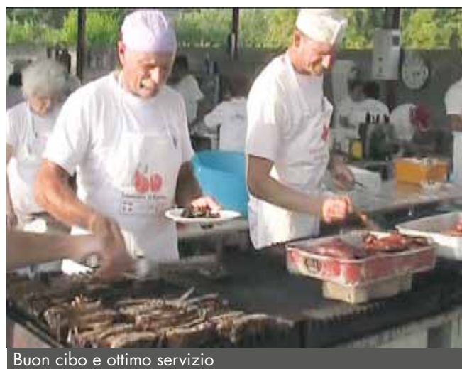
Buon cibo e ottimo servizio