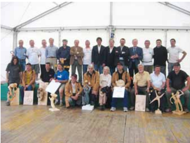
Concorso di intaglio e scultura del legno