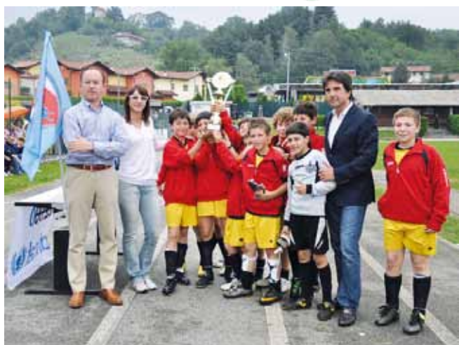
Torneo nazionale pulcini Sette - Pertegato