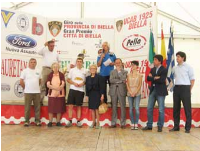
Gara ciclistica UCAB del 2 giugno 2012