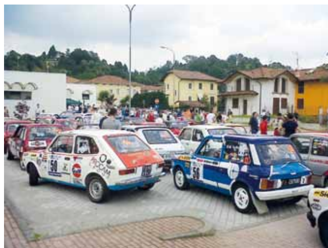
Raduno rallystico in piazza a Valdengo