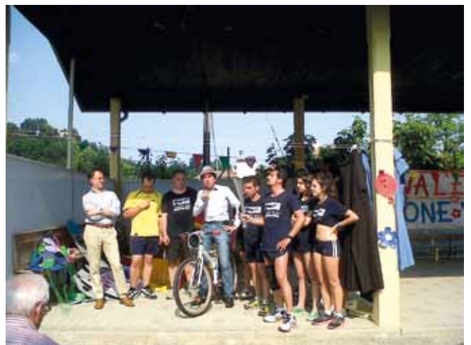
L'arrivo della fiaccola degli SPECIAL OLYMPICS