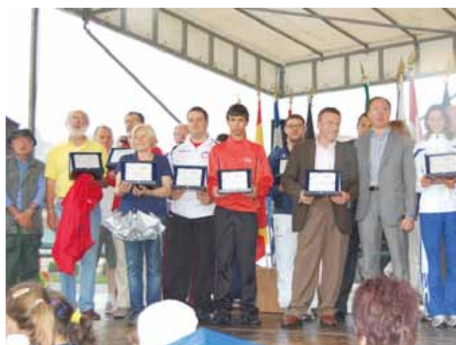
Cerimonia di premiazione