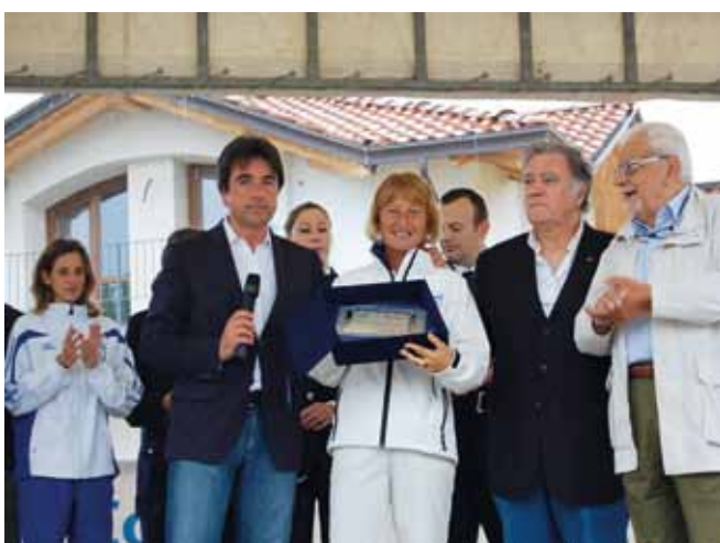
Giornata nazionale dello sport. 3 giugno 2012