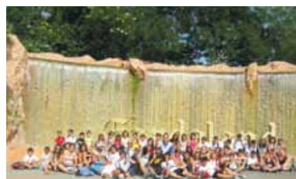
In gita a Gardaland

GRAZIE A TUTTI GLI ANIMATORI PER LE EMOZIONI E IL DIVERTIMENTO.