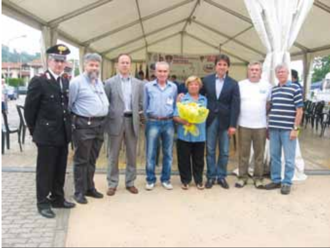
Cerimonia di apertura di "Valdengo in Festa 2012"