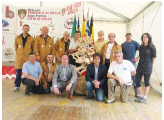
Un capolavoro in mostra