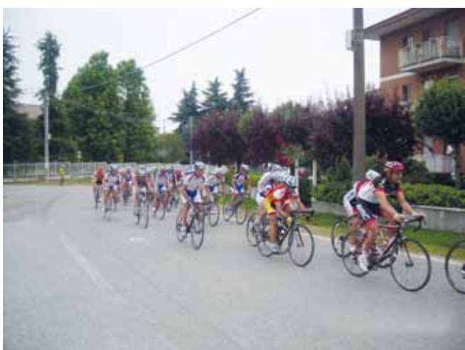
Gara provinciale organizzata dal Gruppo Amici Ciclismo